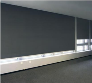
Oscurecimiento con tejido blackout