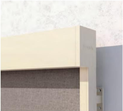
VS6100, VS6200 cuadrado